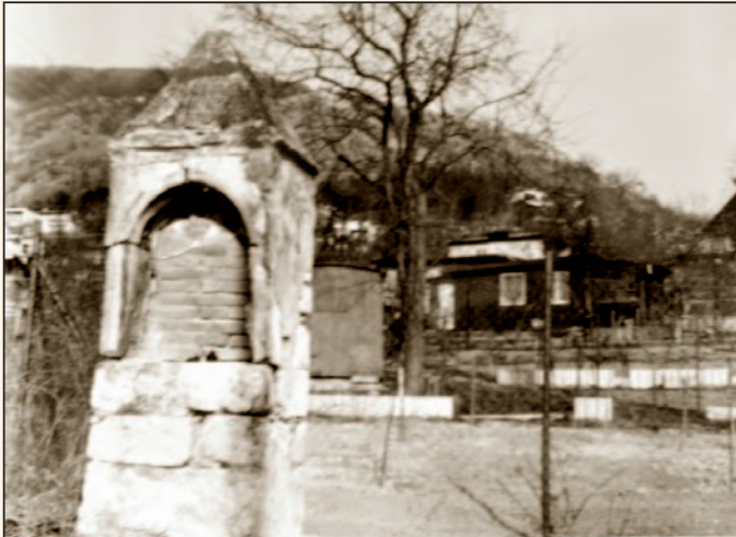
„Božia muka“ na konci Devína pred ob- novou vyzerala naozaj ako muka...

Približne pred desiatimi rokmi bola rekon- štruovaná mestskou časťou prostredníctvom financii z fondu Pro Slovakia. Aj vďaka „ošetrovateľom“, ktorí ju za posledné obdobie niekoľkokrát natierali, aby zakryli grafity a ľudom, ktorí k nej nosia kvety, je súčasný pohľad na ňu omnoho prívetivejší.