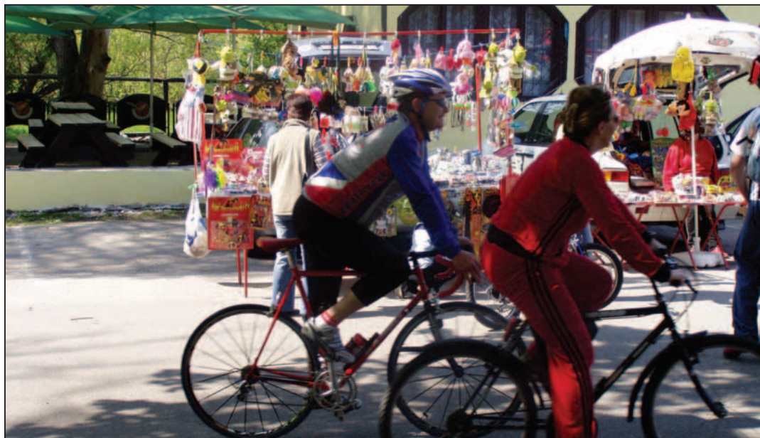
Teplé počasie vylákalo do Devína už počas prvých jarných víkendov množstvo turistov. K turistickej sezóne a k jej atmosfére patria aj stánky na parkovisku pod hradom s rôznymi pestrými drobnosťami a veru, každý sa rád pristavil... (s)