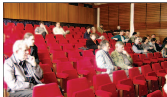
Väčšina Devínčanov mala v čase podujatia asi iný, zaujímavejší program...