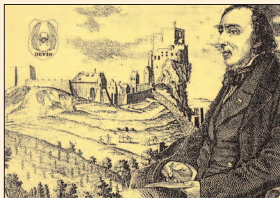
Spomienka na návštevu H. CH. Andersena na Devíne