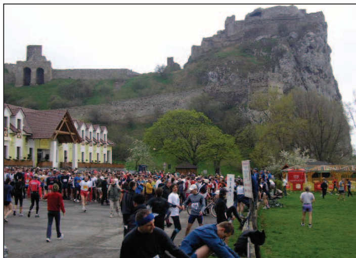
Pár minút pred štartom...

Dvojnásobná víťazka tohto behu z minulých rokov Polka Izabela Za-