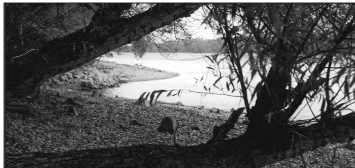
Zábery zo Slovanského ostrova