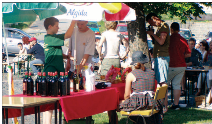
Ani horúčava neodlákala hodovníkov od kvalitného vína. Každý sľečník prinášal úľavu...

li" by im mohli závidieť aj dlhoroční profíci. Mimochodom Devínky (dievčatá do 10 rokov) sa podobne ako ich staršie kolegyně už môžu pochváliť viacerými úspechmi na významných súťažiach a vystúpeniach.