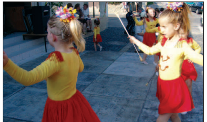
Program otvorili svojim vystúpením Devínky, ktorých umenie potešilo snáď všetkých prítomných.