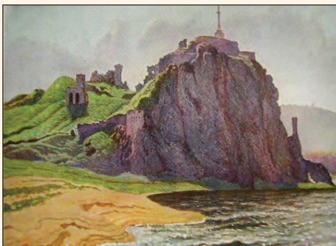
Okrem prírody a krásneho prostredia Devína umelcov inšpiruje najmä Hrad Devín. Toto očarujúce dielo vytvoril akademický maliar V. Malý.

Združenia slovenskej inteligencie KORENE a SLOVAKIA PLUS Slobodná rada slovenského národa - obnovená SNR Miestny odbor Matice slovenskej, Bratislava I Rim. kat. farský úrad Bratislava - Devín Spolok priateľov staroslávneho Devína OZ Slovenský juh, Devínsky cech