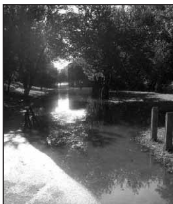
Takto to vyzeralo na niektorých miestach 25. augusta v popoludňajších hodinách...

Leta sme si ani neužili, zato vody naozaj výdatne. V polovici júla nás opäť prekvapila „veľká voda“. 13. júla boli niektoré záhradky pri Devínskej ceste zaplavené vyliatym Dunajom, Moravou bol zatopený cyklistický chodník a areál koniarnie. Kalná voda, ktorá obmývala hradné bralo, sa nebezpečne približovala k rodinným domom. Dunaj dosiahol výšku takmer 7 metrov a bol vyhlásený prvý stupeň