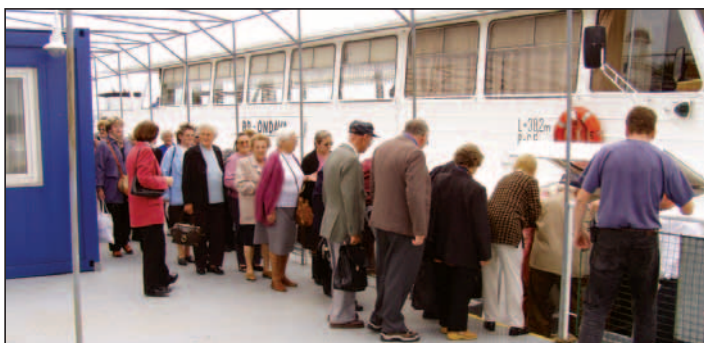
Nástup do lode chvíľku trval...