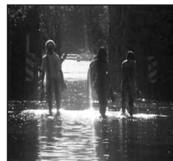
...pri hradnom brale, ak ste chceli prejsť, bolo sa treba vyzuť a vyhrnúť si nohavice.

Prípadnému zaplaveniu mesta a Žitného ostrova má zabrániť rozšírenie koryta Dunaja pod Bratislavou z 300 na 420 metrov v dĺžke tri kilometre, ako aj ďalšie technické opatrenia v centre mesta. Následne by mala byť vybudovaná aj ochrana mestských častí Devín a Devínska Nová Ves. Náklady na vybudovanie ochrany na týchto miestach sú vysoké a možno bude potrebné nájsť financie z iných zdrojov.