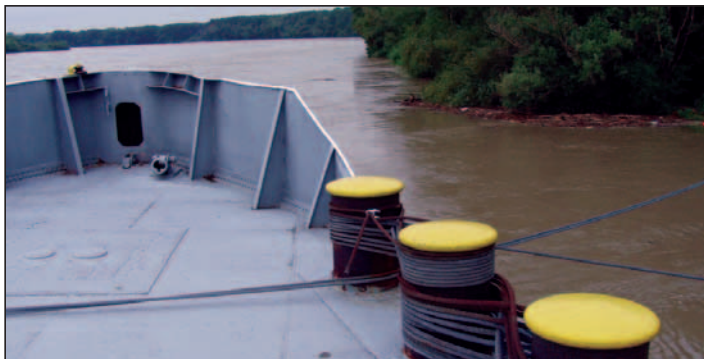
Výletná loď s jubilantmi čerila rozbúrenú hladinu veľkej vody.

nos na prípravu občerstvenia (celé občerstvenie pripravila kultúrna komisia) a realizáciu tejto tradície.