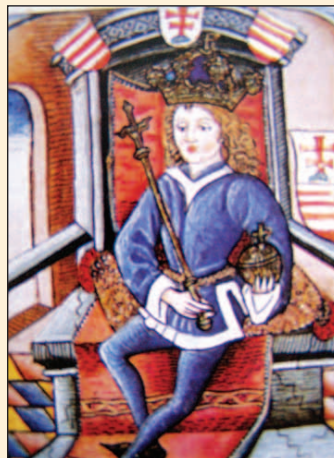
Ľudovít I. „Veľký“

Uhorský panovník Ľudovít I., zvaný Veľký, bol dva krát ženatý. Prvá manželka