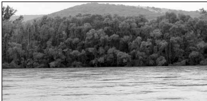
Pohľad na rozbúrený Dunaj a rakúsku stranu v polovici júla.

Leta sme si ani neužili, zato vody naozaj výdatne. V polovici júla nás opäť prekvapila „veľká voda“. 13. júla boli niektoré záhradky pri Devínskej ceste zaplavené vyliatym Dunajom, Moravou bol zatopený cyklistický chodník a areál koniarnie. Kalná voda, ktorá obmývala hradné bralo, sa nebezpečne približovala k rodinným domom. Dunaj dosiahol výšku takmer 7 metrov a bol vyhlásený prvý stupeň