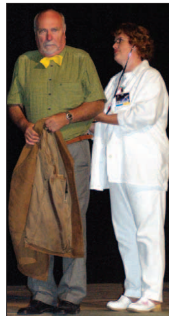
Kontrola zdravotného stavu je potrebná...