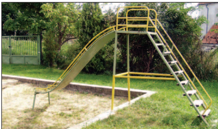
Rodičia detí by radi vylepšili na ihrisku, čo sa dá, ale nevedia, či to má zmysel, kedy sa rekonštrukcia uskutoční.