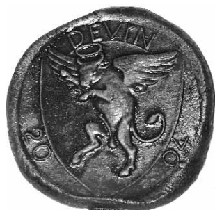
Posledné pečatidlo s okrídleným býkom je súčasťou starostovských inšigníí.

Naša mestská časť, ako jediná zo všetkých mestských častí Bratislavy nemá zapísané v registri symboly obce - vlajku a erb. Miestny úrad preto vyvinul iniciatívu, aby naše symboly boli do Heraldického registra SR zapísané.