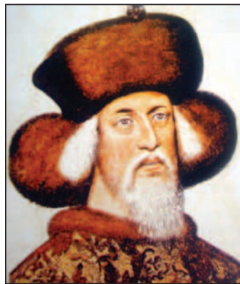
...a kráľ Žigmund Luxemburský