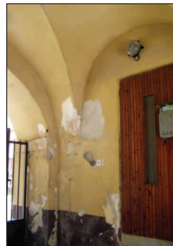
Neprijemný je aj vzhľad vstupu do materskej školy. Opadávajúca omietka, stamúca budova (vo vlastníctve magistrátu) vyzerá zvonka ako čokoľvek iné, len nie budova materskej školy.