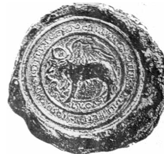
Podoba pečatidla Devína z roku 1910.

la, najmä "Skutky apoštolov" poznali aj solúnski bratia sv. Cyril a sv. Metod, lebo sv. Lukáš svoje diela písal po grécky, takže máme byť na čo hrdí.