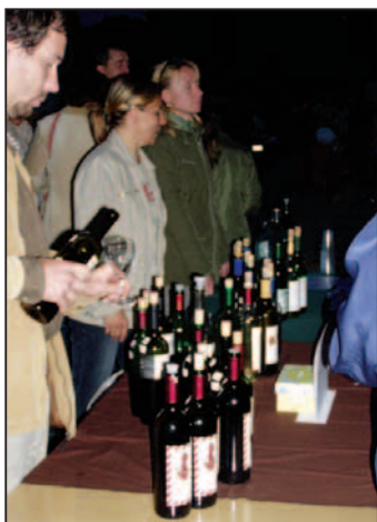
Aj keď vína bolo dosť, najviac chutil burčiak.

Čas prvého vína a burčiaku je pre Devín veľkou udalosťou už po stáročia a kvalitné víno k nemu neodmysliteľne patrí. Je až zázračné, ako sa vždy zlepši počasie v ten deň, keď sa má u nás uskutočniť nejaké kultúrne podujatie na námestí. Výnimkou