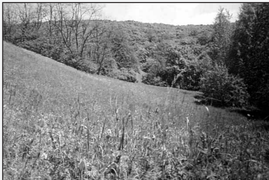
Malebné lúky vo Fialkovej doline - prírodnej rezervácii.