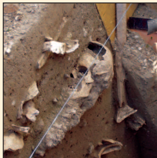
Zo strán vykopanej jamy, kde sa našli vzácne nálezy trčia ďalšie lebky a kosti.

Pri devínskom kostole sa v súčasnosti uskutočňujú archeologické a geologické práce. Pozdĺž jeho pravej steny sa našli pozostatky viacerých svedkov histórie. Vo vykopanej jame