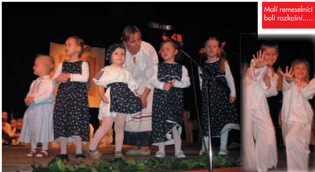
Malí remeselníci boli rozkošní.....