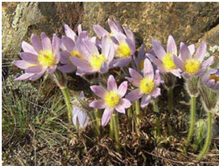
Poniklec veľkokvetý ( Pulsatilla grandis )

My Bratislavčania, najmä obyvatelia mestských častí Devín, Devínska Nová Ves, Dúbravka máme tú výhodu, že mnohých vzácných predstaviteľov teplomilnej flóry Slovenska môžeme obdivovať blízko svojho bydliska, na Devínskej Kobyle v rovnomennej národnej prírodnej rezervácii.