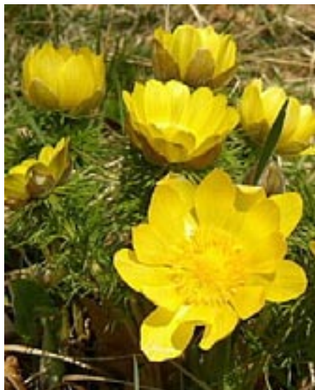
Hlaváčik jarný ( Adonis vernalis )

Kým kvitnutie poniklecov a hlaváčikov už doznieva, kosatce sú ešte v plnej paráde. Najskôr