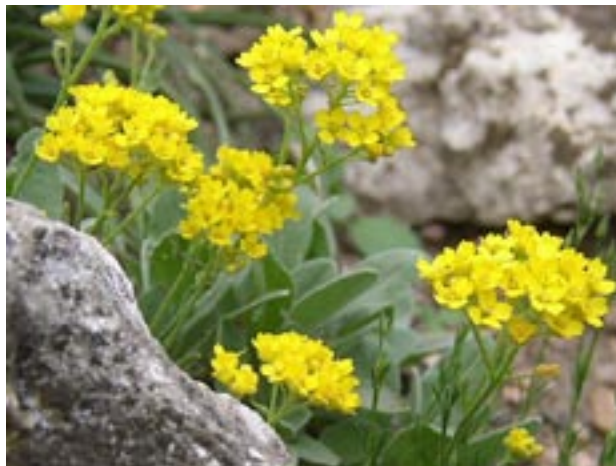
Tarica skalná ( Aurinia saxatilis )

Štátna ochrana prírody i dobrovoľní ochrancovia sa snažia udržiavať priaznivý stav ohrozených biotopov v okolí Bratislavy. Mnohé nebezpečne zarastajú náletovými drevinami a expanzívnymi vysokosteblovými trávami. Zatiaľ, čo na svahoch Devínskej Kobyle, kde sa realizovali v rámci programu starostlivosti o chránené územie manažmentové